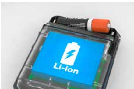
Sistema de doble batería ecológica (ilustración)

Gracias al sistema de doble batería, los pacientes pueden ser monitorizados durante más de 14 días sin