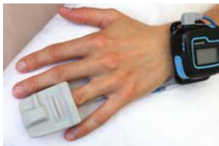
Sensor de SpO 2 , conectado durante la noche

Gracias al registro de respiraciones derivadas del ECC, el Holter medilog®AR puede detectar posibles episodios respiratorios durante el sueño. El sensor opcional de SpO 2 , conectado por Bluetooth, permite registrar información respiratoria adicional.